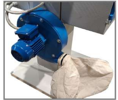
Aspiratore / Aspirator